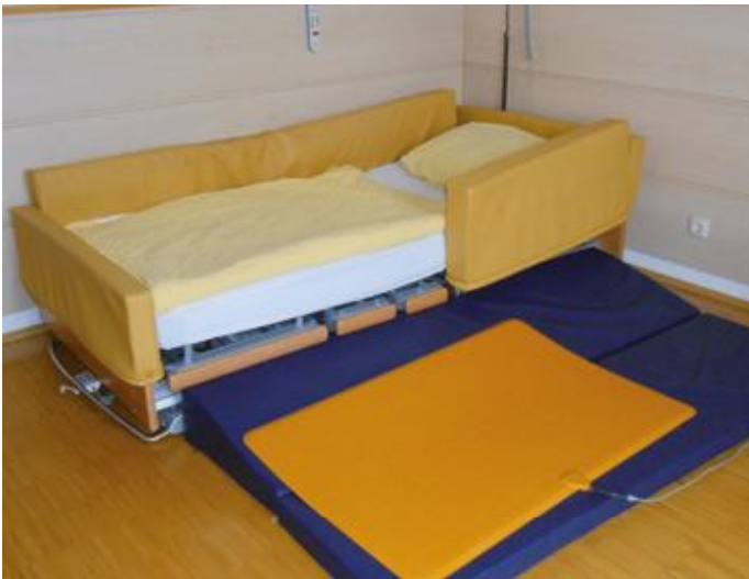
Im Bild: speziell gepolstertes Niedrigbett mit Sturz- und Sensormatte

Durch die gestörte Muskelkoordination kommt es im weiteren Verlauf zu Schluck- und Sprachstörungen.